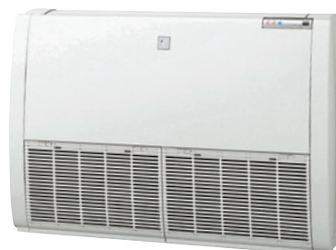
For stående montage